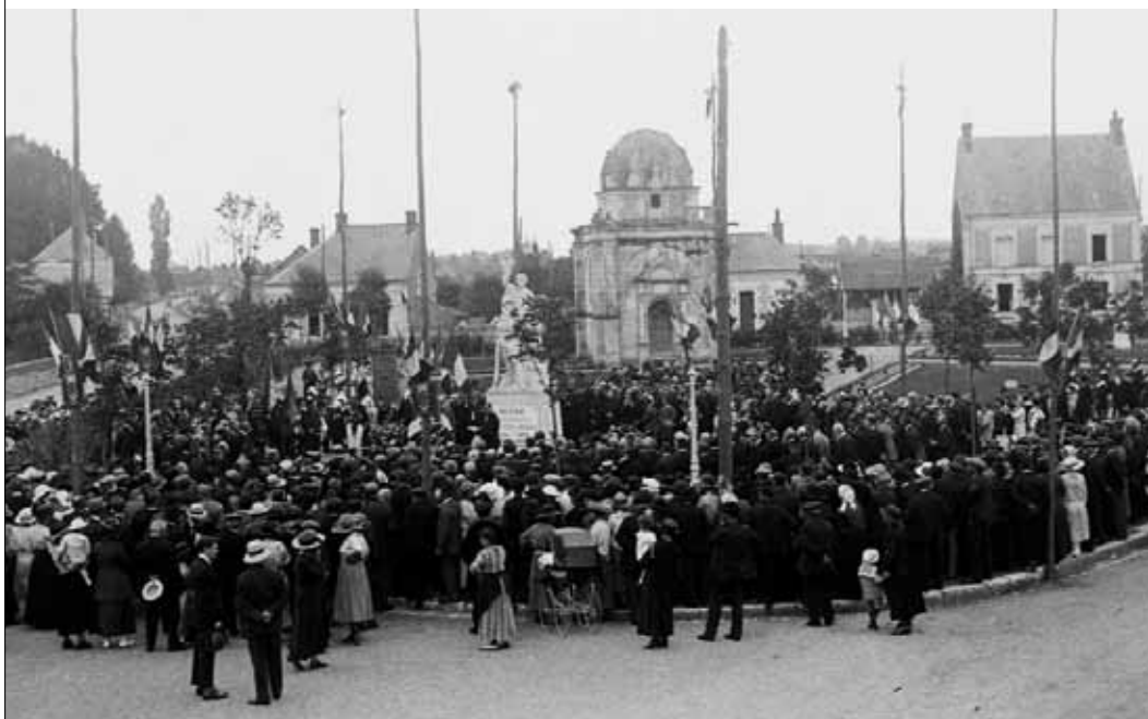
Inauguration du monument aux morts le 8 juillet 1923 (© photo Georges Lemaître, Lux In Fine.

Ce nom a été donné à une portion de l'ancienne route allant à Saint-Georges sur Cher pour commémorer la fin de la Première Guerre mondiale. Un